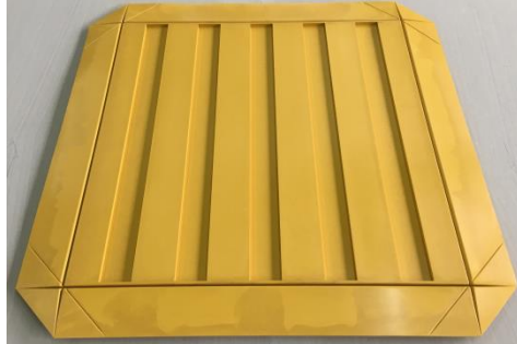
裏面/線平行タイプ