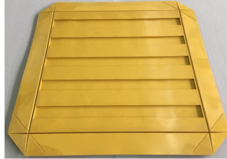
裏面/線直角タイプ